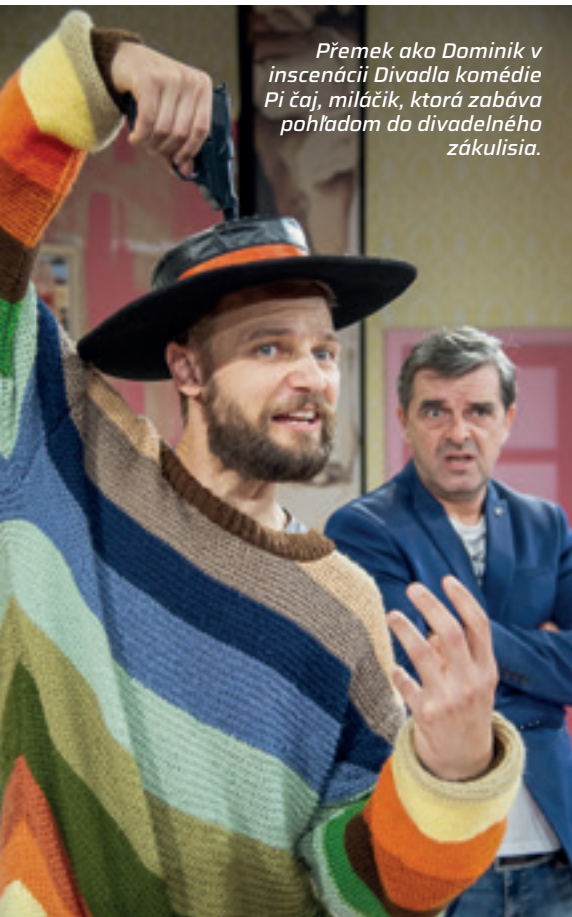
Přemek ako Dominik v inscenácii Divadla komédie Pi čaj, miláčik, ktorá zabáva pohľadom do divadelného zákulisia.