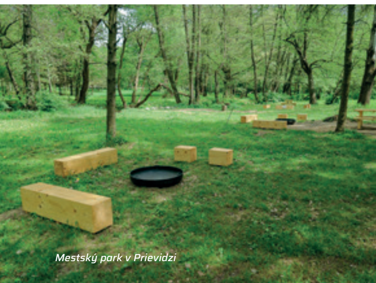
Mestský park v Prievidzi

Projekt sa navyše postupne rozšíril. Mesto doplnilo detské herné a edukačné prvky, pribudli preliezačky, šmýkačky aj exteriérové počítačové. Workoutové zostavy vznikli vďaka ďalšej iniciatíve. Handpark tak rástol spolu s komunitou a dnes tvorí plnohodnotný oddychový areál.