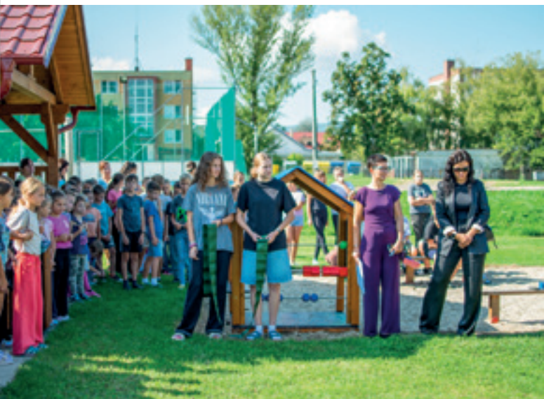
Otvorenie vynoveného školského dvora v Oslanoch