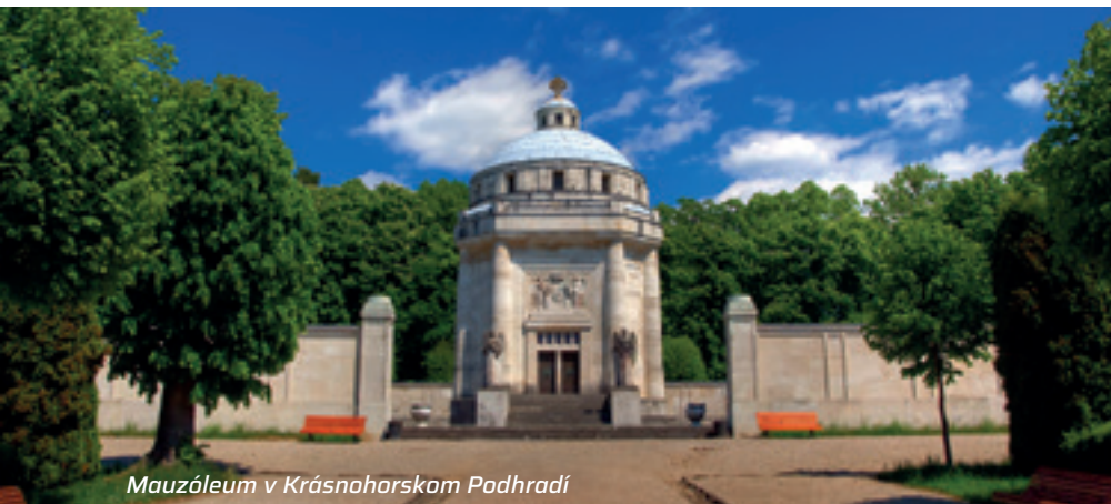
Mauzóleum v Krásnohorskom Podhradí