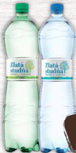
Zlatá Studňa pramenitá voda 2 druhy 1,5 l jednotková cena 0,23 EUR/l