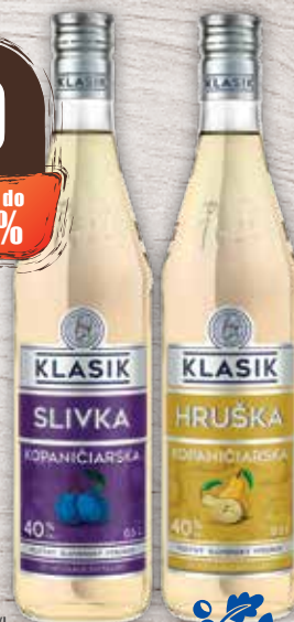
Klasik Kopaničarska Slivka 40% 0,5 l Kopaničarska Hruška 40% 0,5 l jednotková cena 8,38 EUR/l