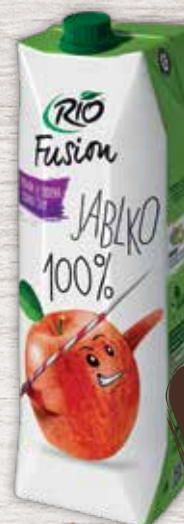
RIO Fusion 100% jablková šťava 1 l