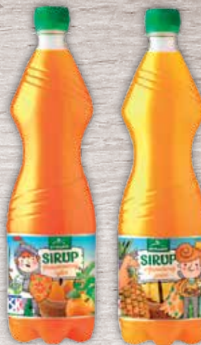
Oravan sirup 2 druhy 0,7 l jednotková cena 1,41 EUR/l