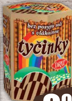
Tyčinky 2 druhy 170 g jednotková cena 5,82 EUR/kg