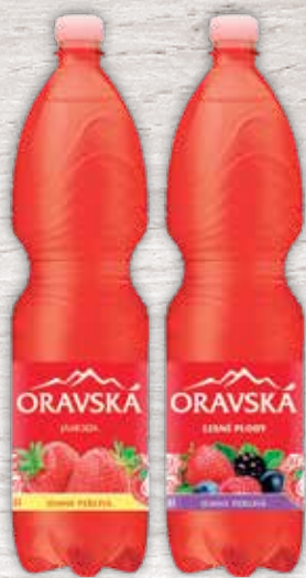
Oravská červená jemne sytý nápoj 2 druhy 1,5 l jednotková cena 0,30 EUR/l