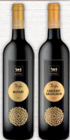
Movino Túžba Muškát 0,75 l jednotková cena 3,99 EUR/l Cabernet Sauvignon 0,75 l jednotková cena 4,39 EUR/l