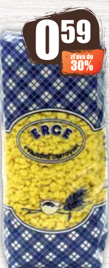
Erce Nitovky 200 g jednotková cena 3,25 EUR/kg Rajbanička 250 g jednotková cena 2,36 EUR/kg