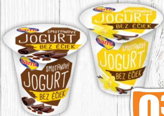
Smotánový jogurt bez éčiek 2 druhy 135 g jednotková cena 2,89 EUR/kg