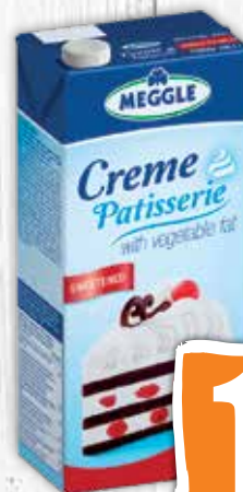
Creme Patisserie 1 l