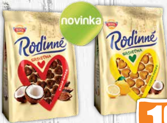
Rodinné srdiečka sušienky 2 druhy 170 g jednotková cena 6,41 EUR/kg