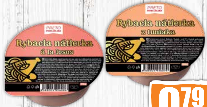
Rybacia nátierka 2 druhy 100 g jednotková cena 7,90 EUR/kg