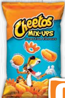
Cheetos Mix-ups Street Food 70 g jednotková cena 9,86 EUR/kg