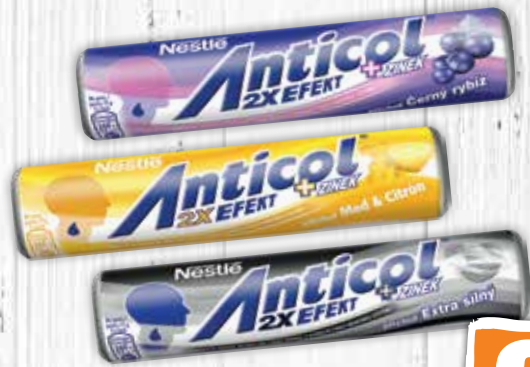
Anticol cukríky 3 druhy 50 g jednotková cena 13,80 EUR/kg