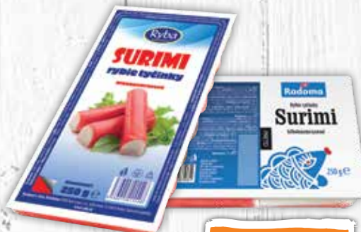
Rybíe tyčinky Surimi hlbokozmrazené 250 g jednotková cena 4,36 EUR/kg