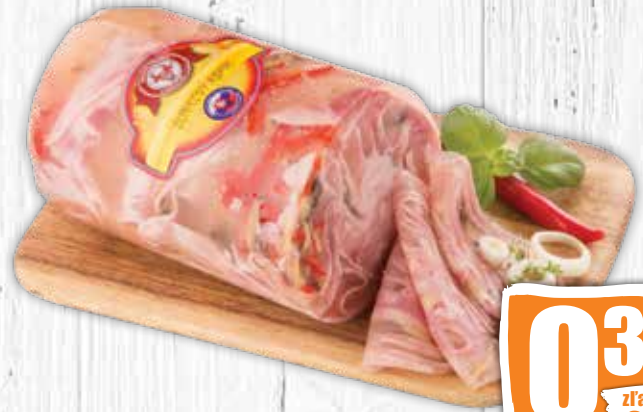
Aspick šunkový 100 g jednotková cena 3,90 EUR/kg