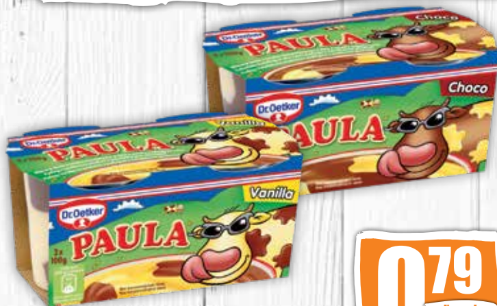
Paula 2 druhy 2 x 100 g jednotková cena 3,95 EUR/kg