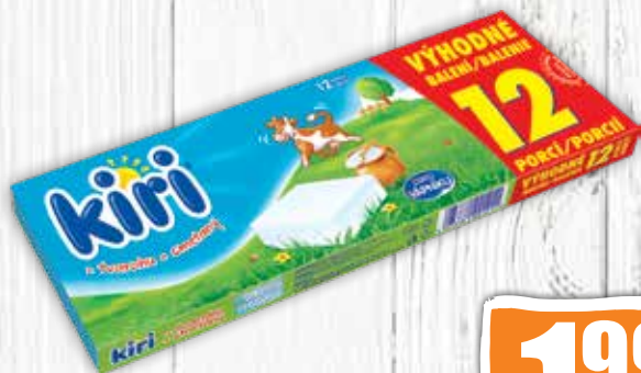
Kiri 200 g jednotková cena 9,95 EUR/kg