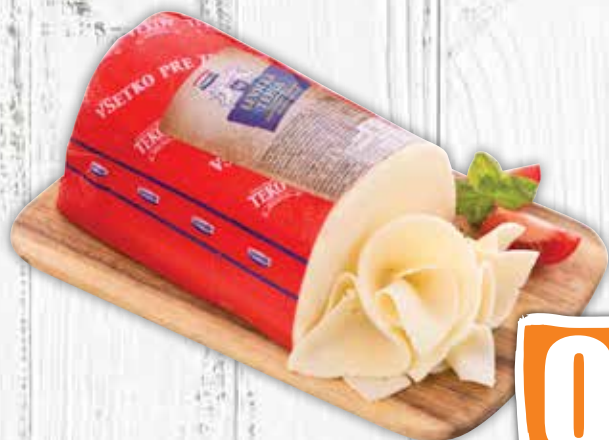
Levická tehla 45% 100 g jednotková cena 6,90 EUR/kg