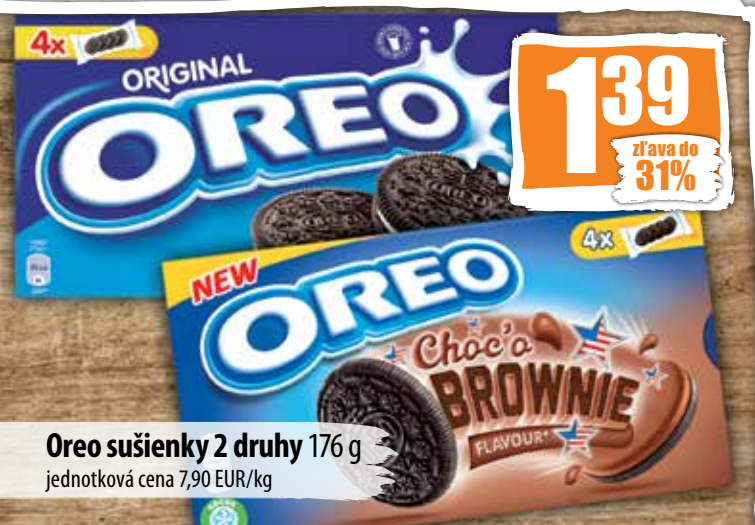
Oreo sušienky 2 druhy 176 g jednotková cena 7,90 EUR/kg