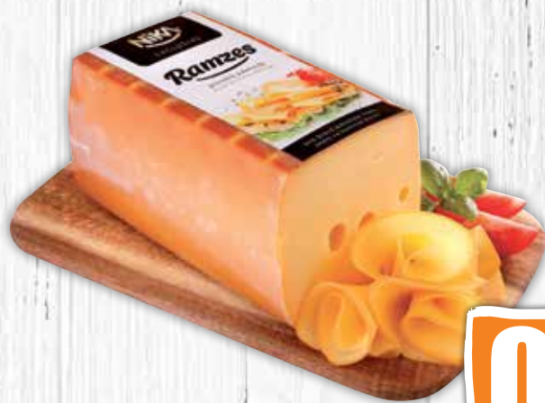
Ramzes údený prírodný syr 100 g jednotková cena 6,90 EUR/kg