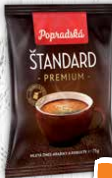
Popradská Štandard Premium mletá káva 75 g jednotková cena 10,53 EUR/kg