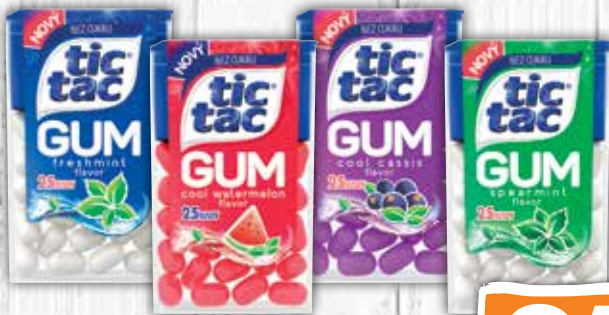
Tic Tac Gum žuvačky 4 druhy 12,1 g jednotková cena 40,50 EUR/kg