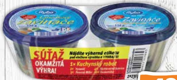
Zavináče lahôdkové 230 g + Zavínáče v majonézovom náleve 230 g 1 bal.