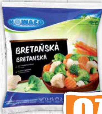
Bretanská zmes hlbokozmrazená 350 g jednotková cena 2,26 EUR/kg