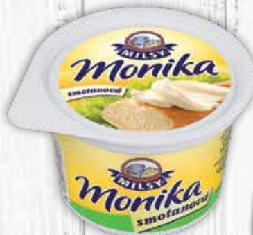
Monika smotanová nátierka 200 g jednotková cena 4,95 EUR/kg