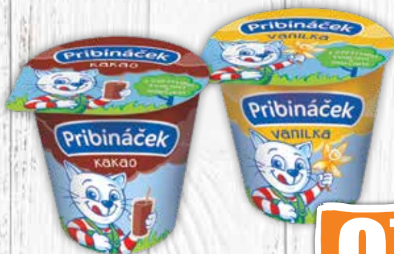
Pribináček 2 druhy 125 g jednotková cena 6,32 EUR/kg