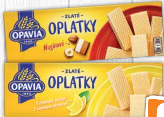
Opavia Zlaté oblátky 2 druhy 146 g jednotková cena 4,93 EUR/kg