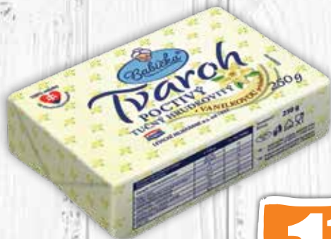
Tvaroh tučný s vanilkovou príchuťou 250 g jednotková cena 4,76 EUR/kg