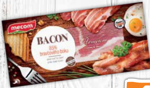
Bacon nárez Premium 200 g jednotková cena 8,95 EUR/kg