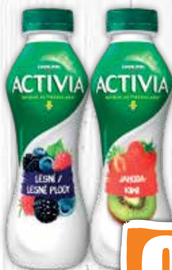
Activia nápoj 2 druhy 310 g jednotková cena 2,74 EUR/kg