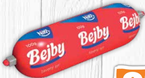
Bejby črievko 100 g jednotková cena 6,90 EUR/kg