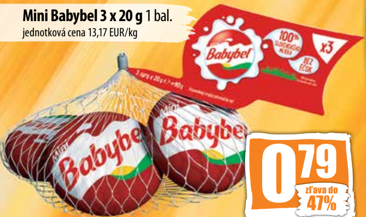
Mini Babybel 3 x 20 g 1 bal. jednotková cena 13,17 EUR/kg