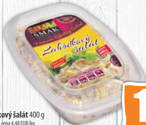
Lahôdkový šalát 400 g jednotková cena 4,48 EUR/kg Vo vybraných predajniach*