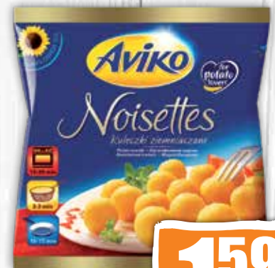
Zemiakové krokety hlbokozmrazené 600 g jednotková cena 2,65 EUR/kg