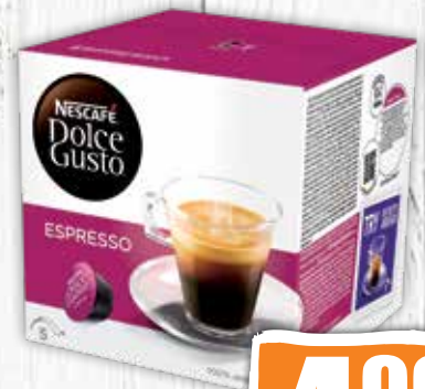
Dolce Gusto Espresso 96 g jednotková cena 51,98 EUR/kg