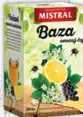
Mistral čaj 2 druhy 40 g jednotková cena 39,75 EUR/kg