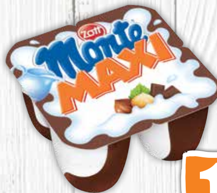
Monte Maxi 4 x 100 g jednotková cena 3,73 EUR/kg