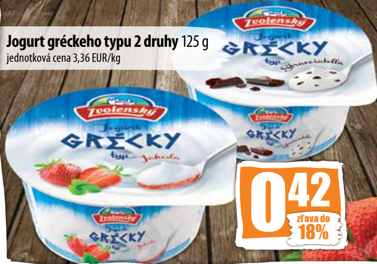
Jogurt gréckeho typu 2 druhy 125 g jednotková cena 3,36 EUR/kg