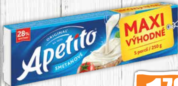
Apetito Originál Maxi 250 g jednotková cena 7,16 EUR/kg