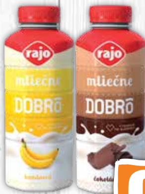
Mliečne Dobró 2 druhy 350 ml jednotková cena 1,97 EUR/l