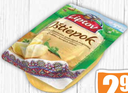
Oštiepok 335 g jednotková cena 8,93 EUR/kg