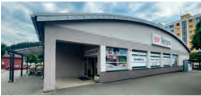
Banská Bystrica – Povstalecká ul.