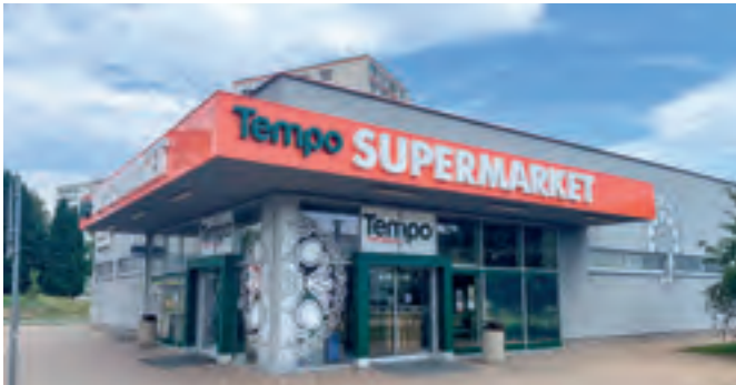
Banská Bystrica – Ul. M. R. Štefánika