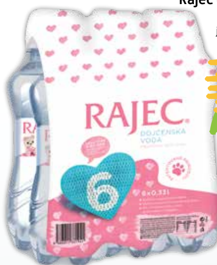
Rajec dojčenská voda 6 x 0,33 l 1 bal. jednotková cena 1,01 EUR/l