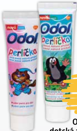
Odol perlička detská zubná pasta 2 druhy 50 ml jednotková cena 13,00 EUR/l