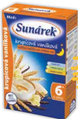
Sunárek mliečna krupicová kaša vanilková 225 g jednotková cena 11,07 EUR/kg