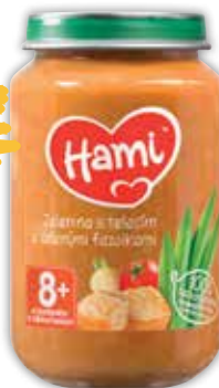
Hami príkrm zelenina s telacím mäsom 200 g jednotková cena 5,95 EUR/kg