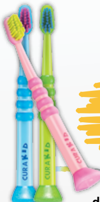
Curaprox CuraKid detská zubná kefka ultra soft 1 ks rôzne farby