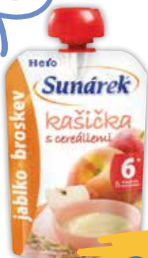
Sunárek kašička jablko a broskyňa s cereáliami 120 g jednotková cena 8,25 EUR/kg