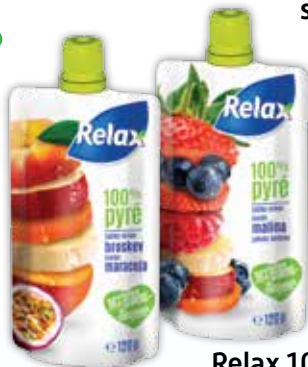
Relax 100% ovocné pyré 2 druhy 120 g jednotková cena 4,50 EUR/kg