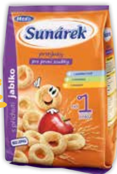
Sunárek jablkové prstienky pre prvé zúbky 50 g jednotková cena 15,80 EUR/kg